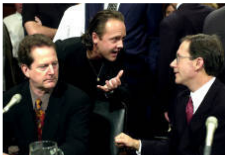
Napster. Metallica forsøgte med sagen mod fildelingstjenesten Napster at stoppe nettets gratister.

Ellers var det mest Jamaica og dancehall, der slog igennem på den mere spraglede musikscene i Danmark, anført af Natasja og Bikstok Røgssystem.