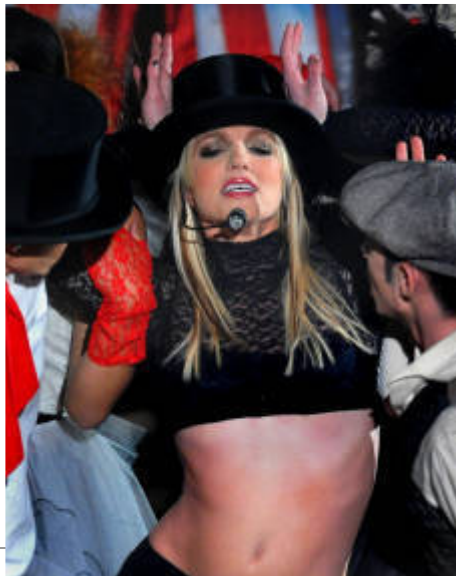
Britney. Med albummet 'Circus' rejste Britney Spears sig fra sølet i den surreelle paparazzitilværelse.

Det er de simpelthen ikke værd over for de ægte varer.