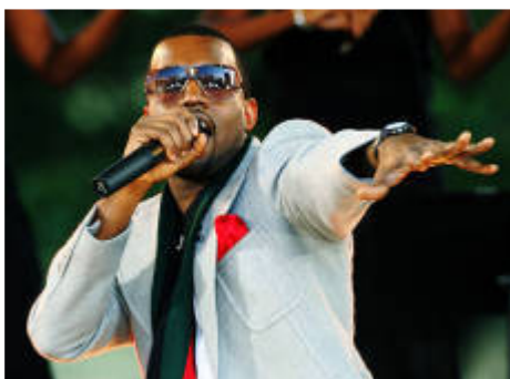
Kanye. Med 'Late Registration' satte Kanye West nye standarder for fusion af hiphop og pop.

Popmusikken rykkede hiphoppen ud af gangsta-ghettoen og ind i en mere moderne tidsalder, anført af den forrygende producer Kanye West, Neptunes samt førnævnte Timbaland.