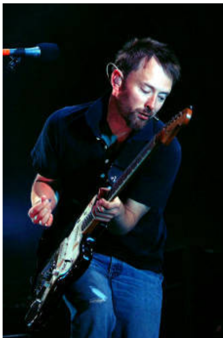
Radiohead udgav albummet 'In Rainbows' via nettet og lod brugerne bestemme prisen.

Ved siden af folk fik også soul et stort revival, anført af det blege britiske problembarn, Amy Winehouse, der tog Duffy, Mark Ronson, Adele, Sharon Jones og mange andre med sig.